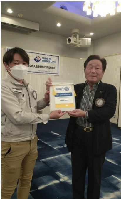
第1位 ロータリー財団年次寄付 年間優秀クラブ 徳島眉山ロータリークラブ

11月29日(月) 場所:ホテルサンシャイン徳島 時間:19時 ~ 家庭集会発表